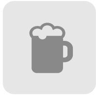
アルコールチェック