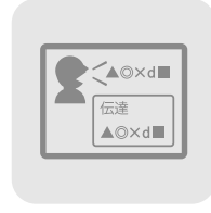
音声伝達メモ機能