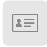
携行品チェック (免許証等)