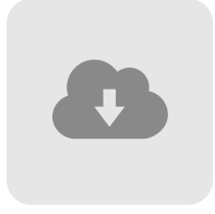
点呼記録簿の 自動作成