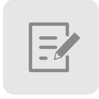
車輛点検記録機能