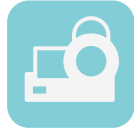
血圧計 (A&D製、オムロン製)