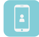
モバイル連携 (中間点呼)