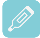
体温計 (フィンガリング製)